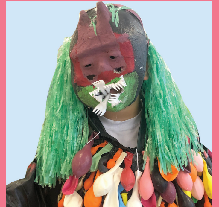
Sittney | Jäger Beschützer der Welt