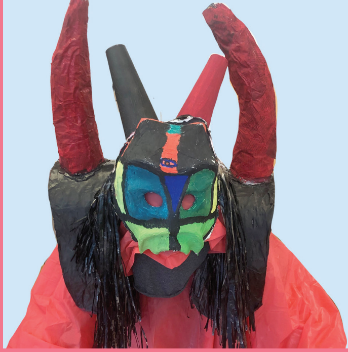
Soul-Dämon | lebt in der Erde ist immer allein