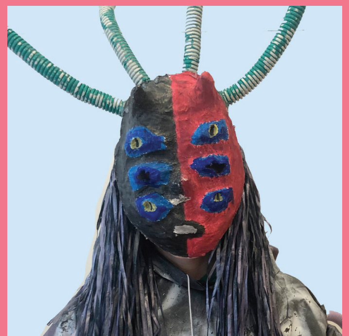
Hungriger Hugo | Influencer blind