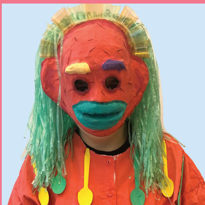
Goku | lebt in den Tag hinein