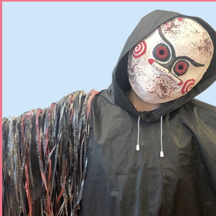
Black Show | tödlich ICH BEOBACHTE DICH XXX