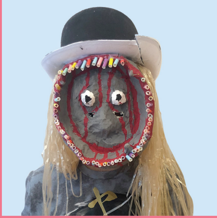
El Raton | Mafiaboss handelt mit Drogenkäse