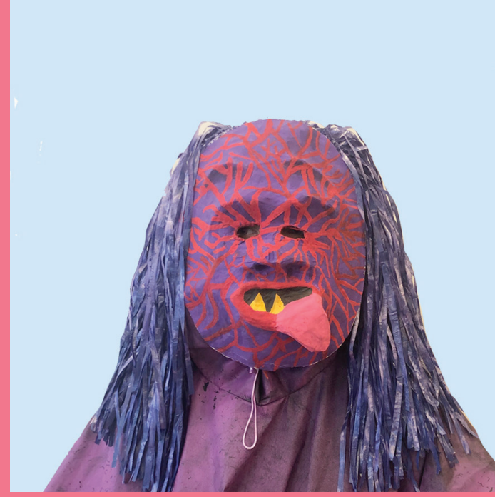
Noname | Mafiagehilfe Versuchsobjekt